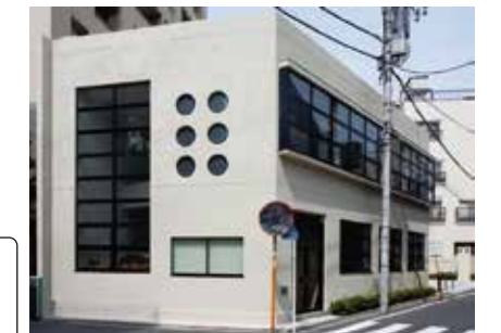
深川東京モダン館

門前仲町1-19-15 ☎03(5639)1776 都営大江戸線・東京メトロ東西線 「門前仲町」駅徒歩3分 昭和7年(1932)に建設された旧東京市深川食堂を改修し、一般に公開。昭和初期のモダンな建築様式を伝える数少ない現存施設として、国の登録有形文化財(建造物)となっている。1階は江東区の観光案内所として、2階では講座、展示、喫茶、落語会などを不定期開催している。観光ガイドが常駐している。 ■(休館日)月曜日(祝日の場合は翌日)